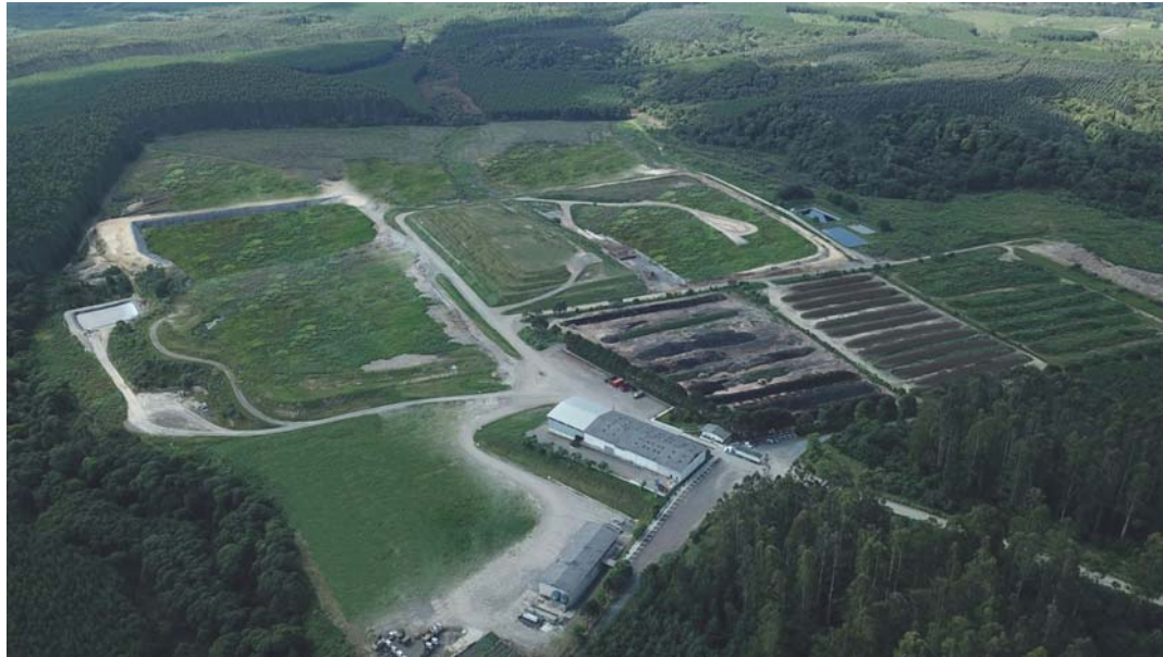
Vista Aérea do empreendimento.